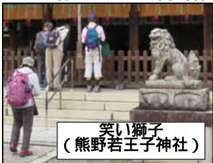
笑い獅子 (熊野若王子神社)