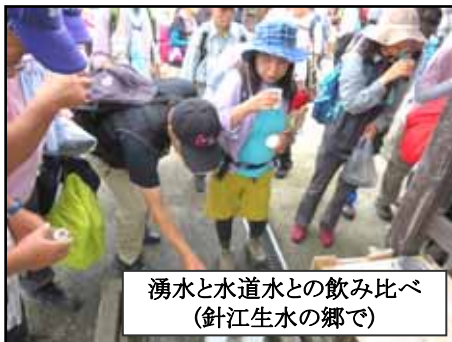
湧水と水道水との飲み比べ (針江生水の郷で)

水に咲くバイカモの花の観賞と楽しんだ後、新旭駅にゴール。水、酒、花と多様な楽しみを体験できたウォークでした。